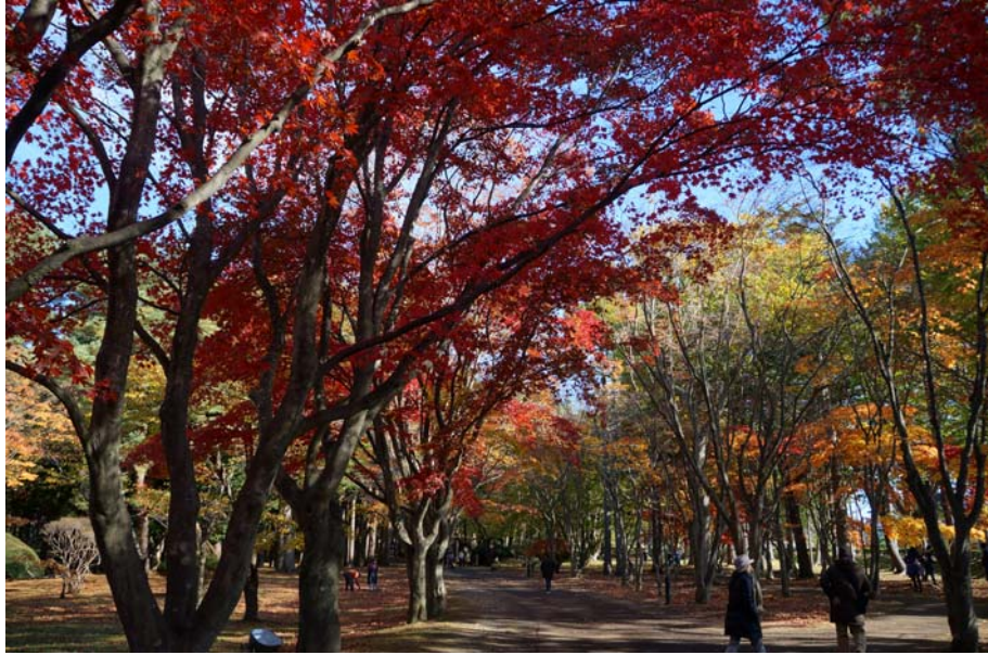
De røde høstfargene

Kousetsu-parken finnes i «Miharu»-distriktet i Hakodate. På japansk skrives Kousetsuen, 香雪園, der den har betydningen «Parkens snø dufter som plummer» og er godt kjent i Japan. Det man får øye på når man nærmer seg parken er de røde løva som, sammen med den blåe himmelen ser ut som et vakkert oljemaleri. Det første jeg tenkte var at dette må være en drøm.